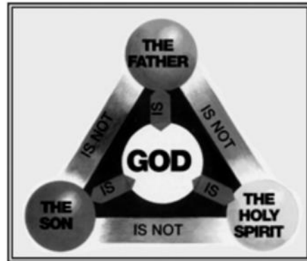
La nueva ayuda pictórica para el estudio de la Biblia , p. 75 IASD