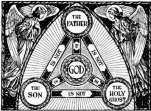
Del libro Mi Fe Católica .

Atanasio y Agustín, los dos hombres que hicieron más para formular la doctrina de la Trinidad que cualquier otro, ambos admiten que no lo entendieron y que no pudieron definirlo. Este concepto de Dios, tan confuso y misterioso como es, es el punto de vista más aceptado entre los cristianos.