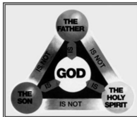
La nueva ayuda pictórica para el estudio de la Biblia, p. 75, SDA